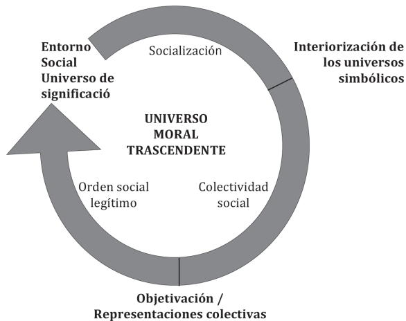
Gráfico 1: Universos simbólicos: universo moral trascendente